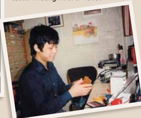
PÅ JOBB: Arbeidsuken i 8. klasse, i Wessel Kabelfabrikk hvor far arbeidet.