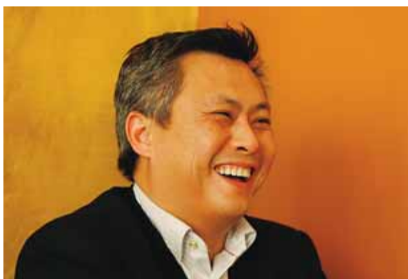
HEGGEDAL ER HJEMME: – Norge er det nærmeste jeg kommer et hjemland. Det er her jeg hører til.

BERGEN I JULI 1978. På bryggekannten står Young og brødrene hans og fisker, slik de gjør nesten hver ettermiddag. Snur han seg, ser han rett på Strand Hotell. Det er der familien hans bor nå, mor