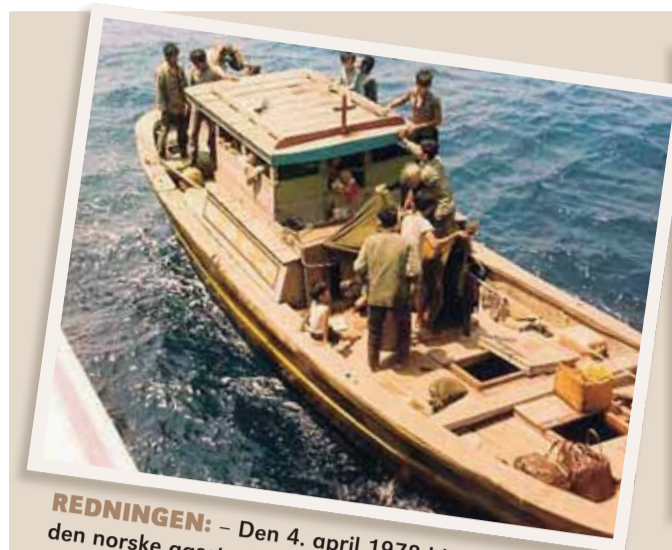
REDNINGEN: – Den 4. april 1978 ble vi berget av den norske gasstankeren «Fernbrook».